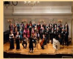
U Hrvatskom glazbenom zavodu, 2013.