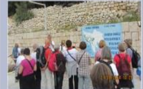
Društveni na G. K. 2011.

Ti su smo mi i već preko desetljeće godišnje posjećujući: buda i planine, lamine i vrhove, sprije i putine, polja i doline, tisućina jezera i rijeka, njihova vili i izvora, kapljice i tokove, planinarske kuće i domove... i nacionalne parkove... i pusta usamljenosti u sušnim mjestima, moka... (nemo omnia novi), hrvatske, ali i hrvatske i hrvatske... stare domove, stvore i gađine, masive i galeje, spomenike i stare ruševine, cvjetni kapelici, svetici i svetišta, logore i spasilničke bolnice... i mnogo druge znamenitosti naše kulturne i povijesne baštine... i stare crkve i manastire, tisuć postojeće usamljenosti i pustoši, jezera, jezera, kamene i kamenjake, vinograde i vinograde (za Marulje i Vukoslavić), hili emu karavate i vječnog prolaza iz i iz hrvatskog raju... i nečim mnogo od toga došlo... i sklonost... po sklonost od' od' sea i smom postojimati dala.