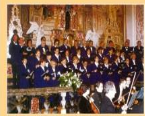
Kolovoz koncert u obitelji sv. Katarine, 1996.

U srpnju Zbor tradicionalno sudjeluje na koncertu zbora Sveučilišta u Zagrebu Peta obilježja zapahom .