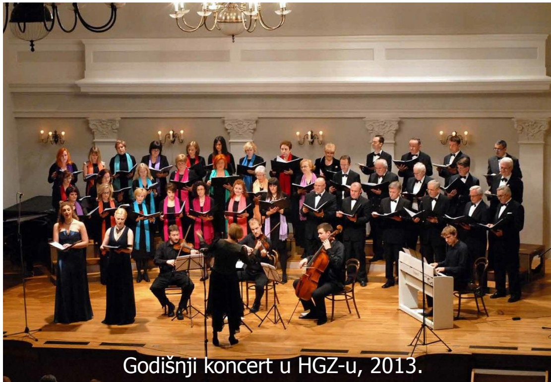
Godišnji koncert u HGZ-u, 2013.