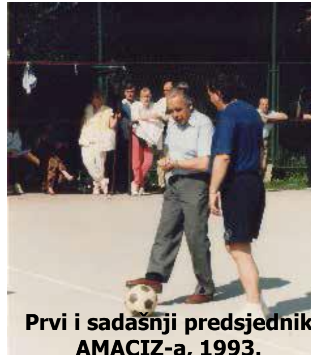
Prvi i sadašnji predsjednik AMACIZ-a, 1993.