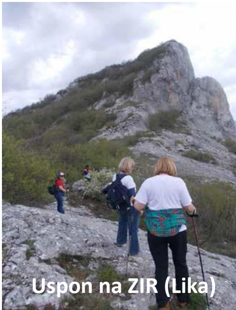
Uspon na ZIR (Lika)