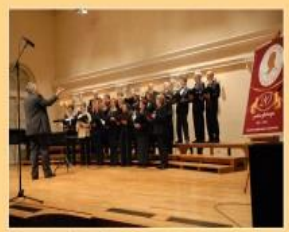
Obilježavanje 20. obljetnice zbora, 2011.