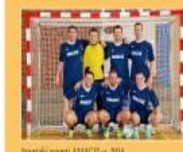
Sportski sastav AMACIZ-a, 2014.