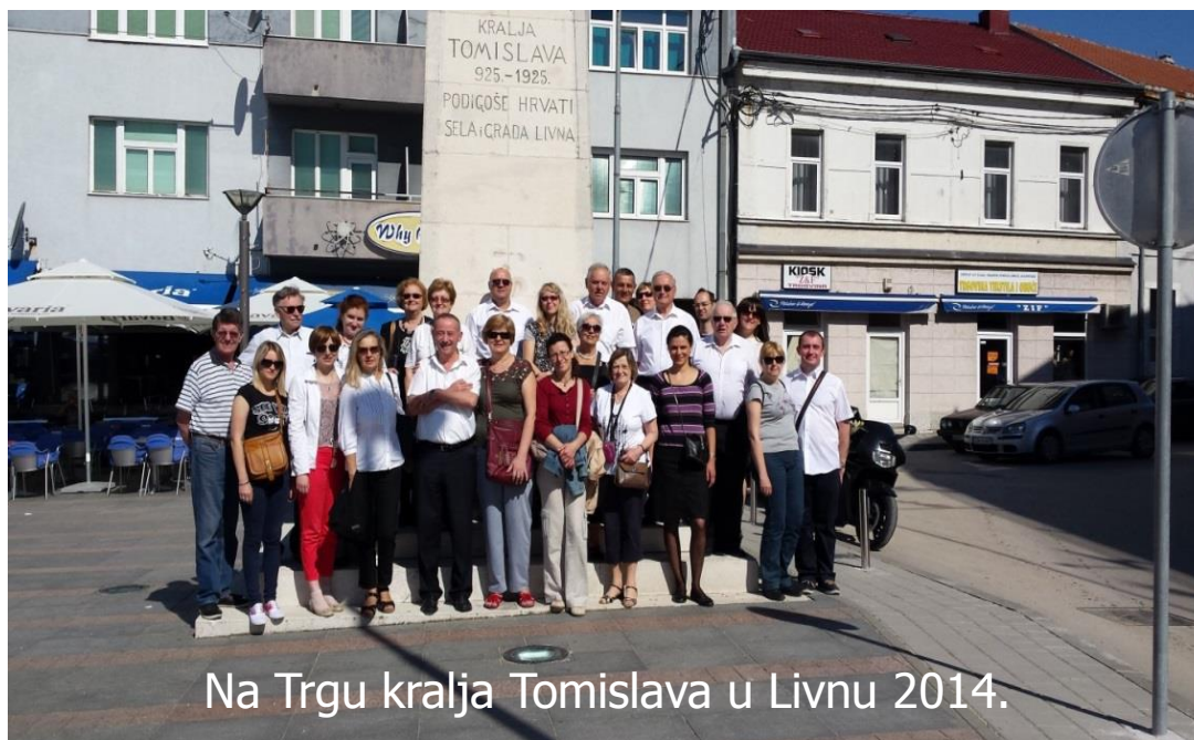
Na Trgu kralja Tomislava u Livnu 2014.