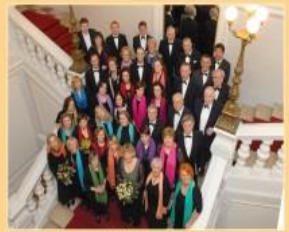
U Hrvatskom glazbenom zavodu, 2014.