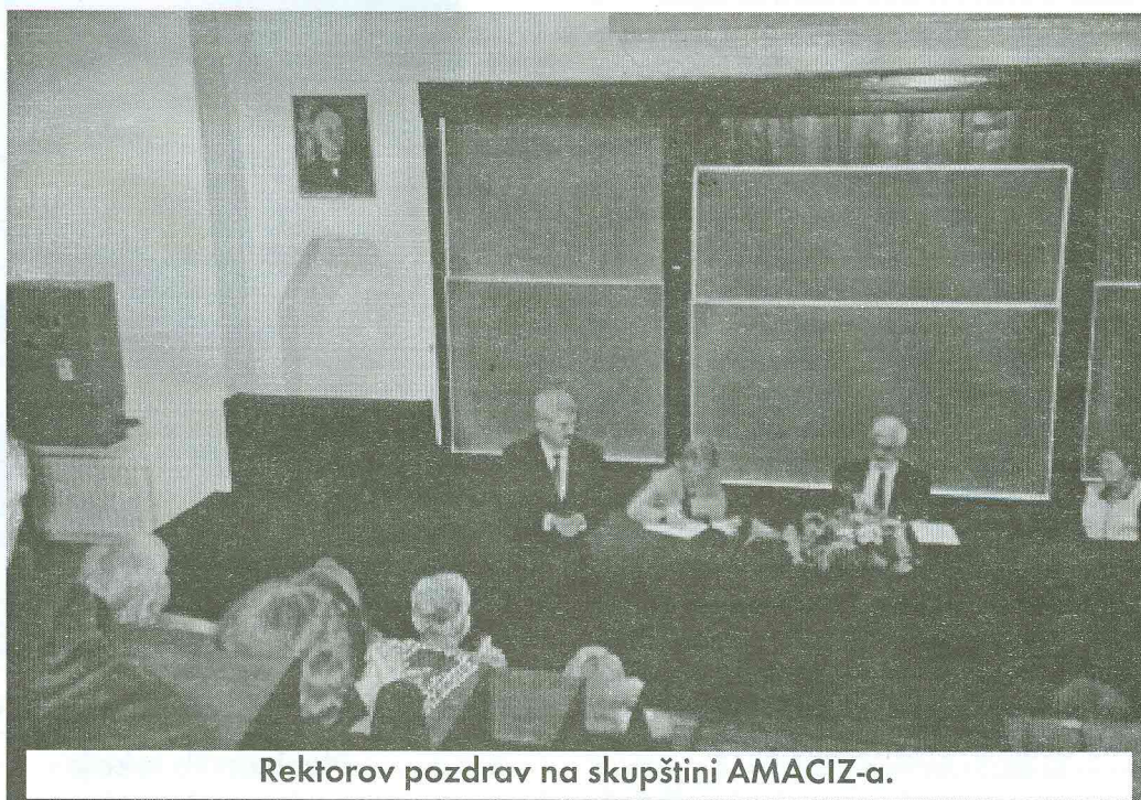
Rektorov pozdrav na skupštini AMACIZ-a.

Suradnja s matičnim fakultetom je osnova našeg djelovanja, tako da sam zamolila našu dekanicu, da FKIT podrži rad Društva u svakom pogledu. Uspostavljena je dobru suradnju sa studentima FKITa kao budućim članovima AMACIZ-a i to putem Glasnika, koji piše i o zajedničkim temama kao što su promocije i Tehnologijada. Studente se odmah po diplomiranju poziva da se učlane u Društvo.