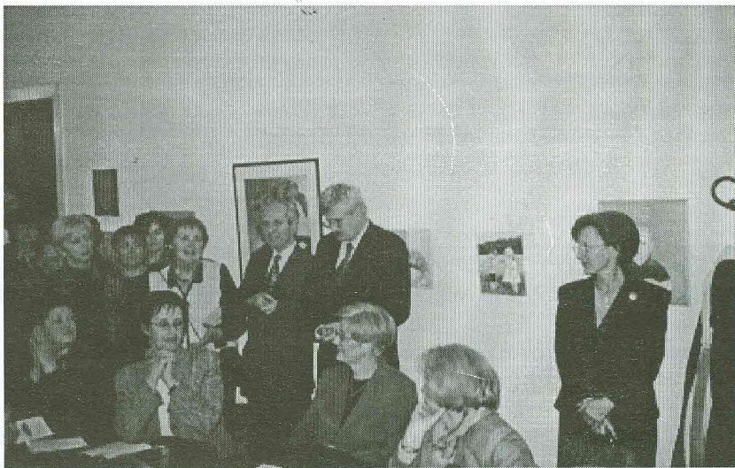
"Rektor i buduća rektorica bili su na otvaranju izložbe Likovne sekcije AMACIZ-a"